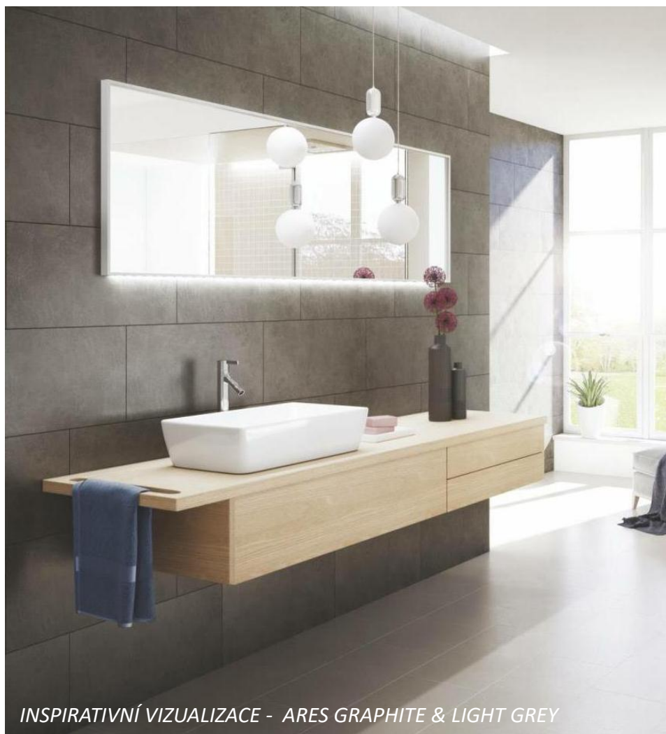
INSPIRATIVNÍ VIZUALIZACE - ARES GRAPHITE & LIGHT GREY