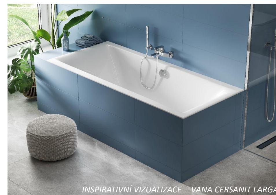
INSPIRATIVNÍ VIZUALIZACE - VANA CERSANIT LARGA