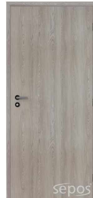
DUB STRÍBRNÝ ŠEDÝ