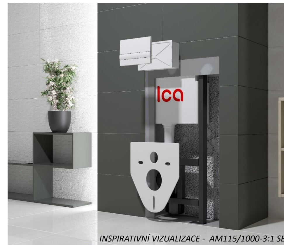
INSPIRATIVNÍ VIZUALIZACE - AM115/1000-3:1 SET